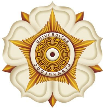
Gb. 1. Lambang 3 (Tiga) Dimensi

Pada awal mulanya, Lambang Universitas Gadjah Mada diwujudkan dalam kalung jabatan Presiden Universitas, Sekretaris Senat, dan Ketua Fakultas. Selanjutnya juga diwujudkan dalam warna-warna dari universitas, dalam vandol dan dalam Tongkat Staf pedel.